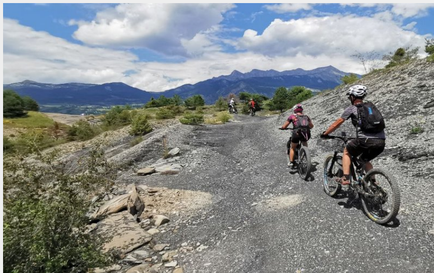
Dans les marnes (Parc national Ecrins - E-Pedal)