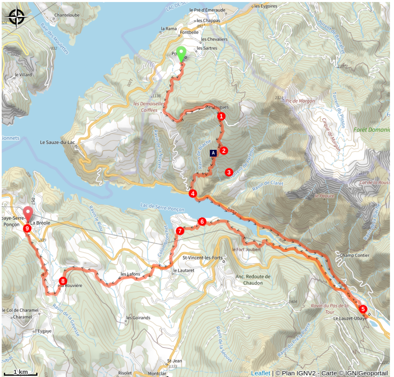
Le Dolmen du Villard (A)