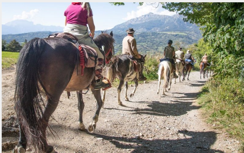
A St Léger Les Mélèzes (Parc national Ecrins - Thibaut Blais)