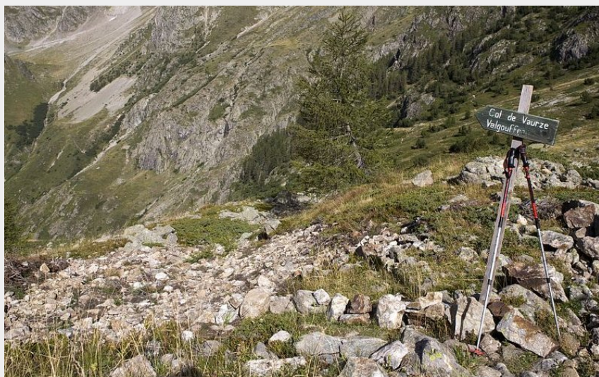
Du refuge des Souffles au col de la Vaurze (Pascal Saulay - PNE)