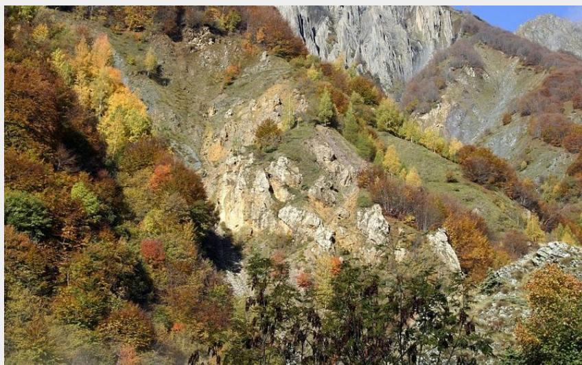
Le bois des Peines et Les Arraches depuis le sentier des Souffles