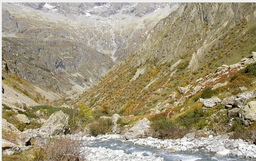
Vallon de Surette (Olivier Wartuzelle - PNE)

CC Champsaur-Valgaudemar - La Chapelle-en-Valgaudémar