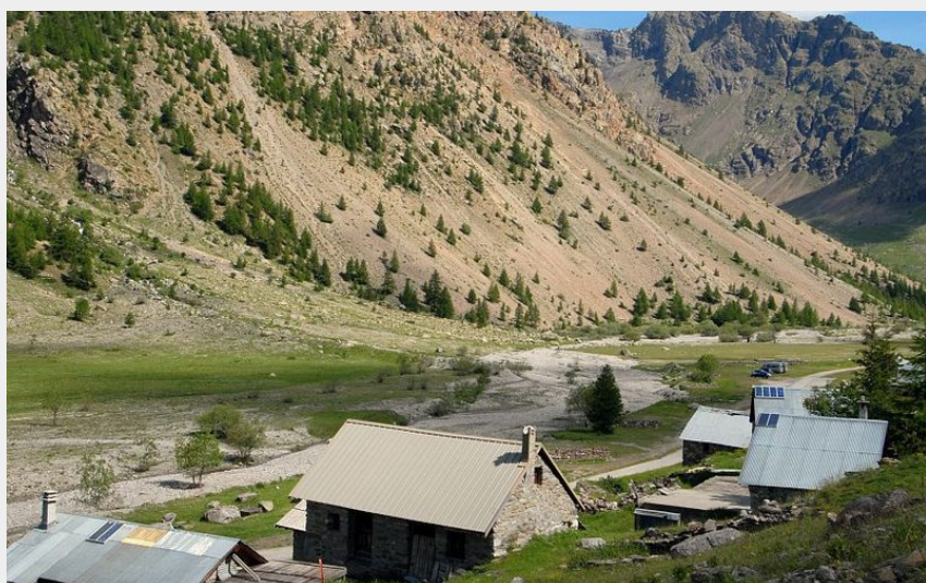
Les chalets de Chambran

CC du Briançonnais - Le Monétier-les-Bains