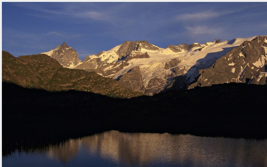
Les Mouterres (Denis Fiat - PNE)