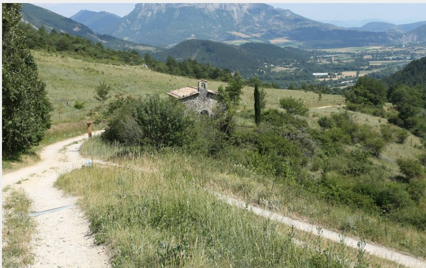
Chapelle de Saumane et vallée du Buëch (Pnr Baronnies provençales)