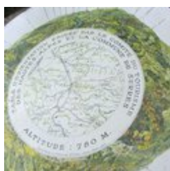
Table d'orientation (D)

Au détour d'un lacet du sentier et juste à côté de la Chapelle Notre-Dame-de-Bon-Secours, profitez d'une superbe vue sur la vallée du Buëch. Un table d'orientation érigée par le Comité du Tourisme des Hautes-Alpes et la Commune de Serres permet de profiter du panorama.