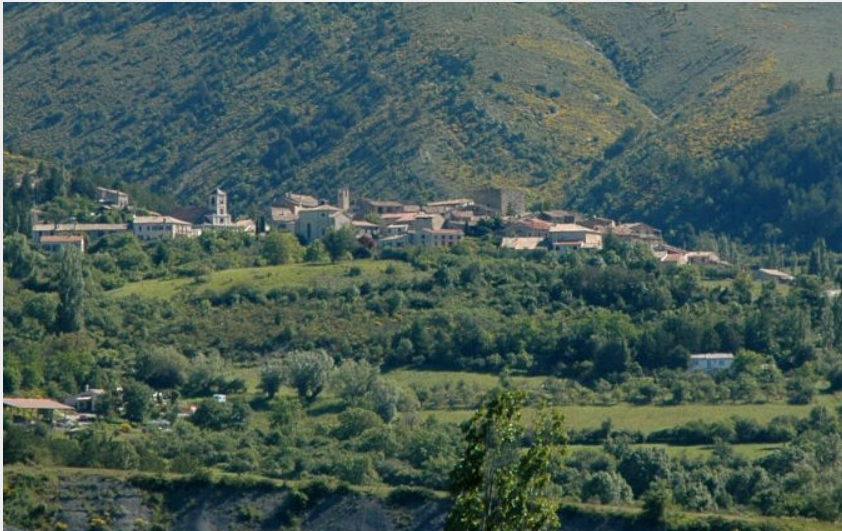
Rosans et le Serre de l'Aigle (A. Carod - PNR Baronnies Provençales)