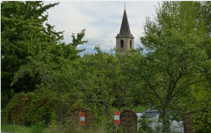
Clocher de Rochebrune (Marine Marcotti)