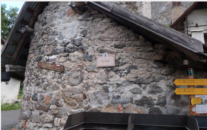
Le four de Plampinet (CDRP05)