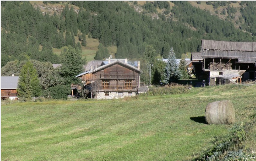
Les chalets de Molines-en-Queyras (CDRP05)