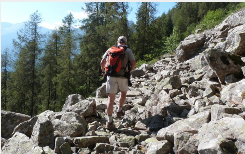
Passage en balcon bordant la Forêt Domaniale du Drac (CDRP05)