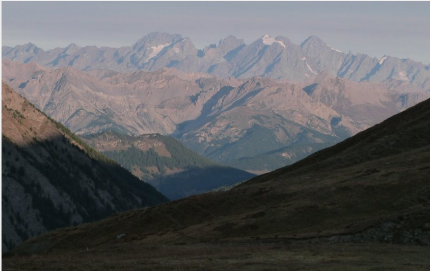
Vue au réveil depuis le Refuge d'Agnel (CDRP05)