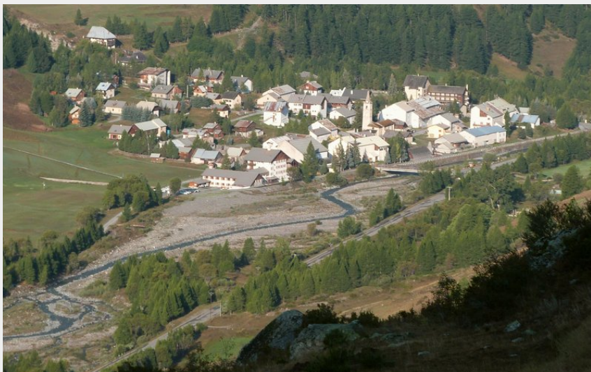
Le sentier surplombe le village de Ristolas (CDRP05)