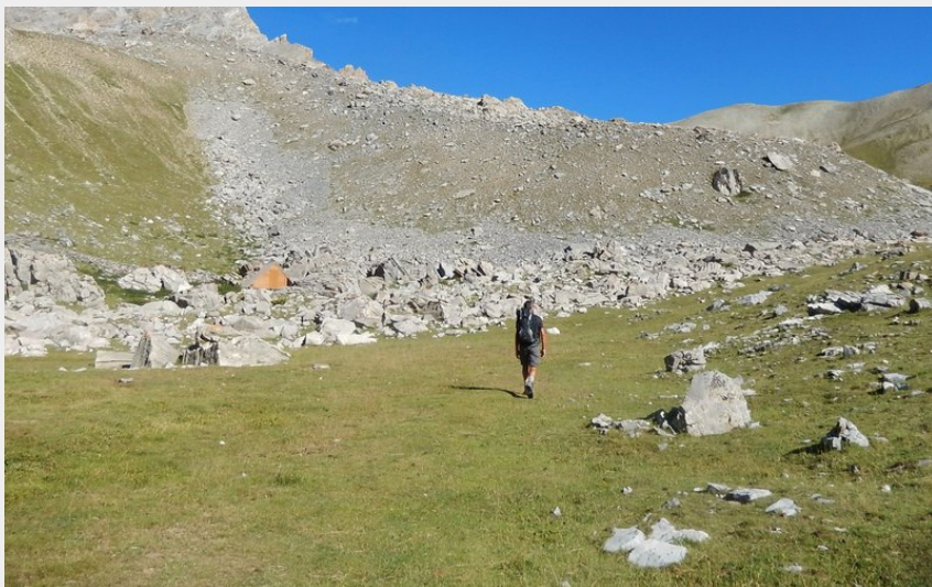
Au pied du Col Girardin (CDRP05)