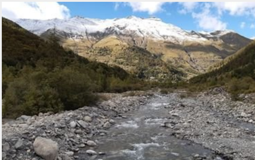
le torrent de Réallon (florimont.tilliere)