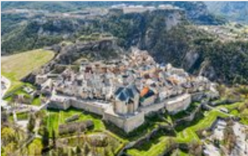
Vue sur la Cité Vauban (OTSCVB)