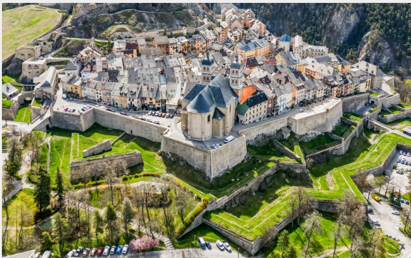
Vue sur la Cité Vauban (OTSCVB)