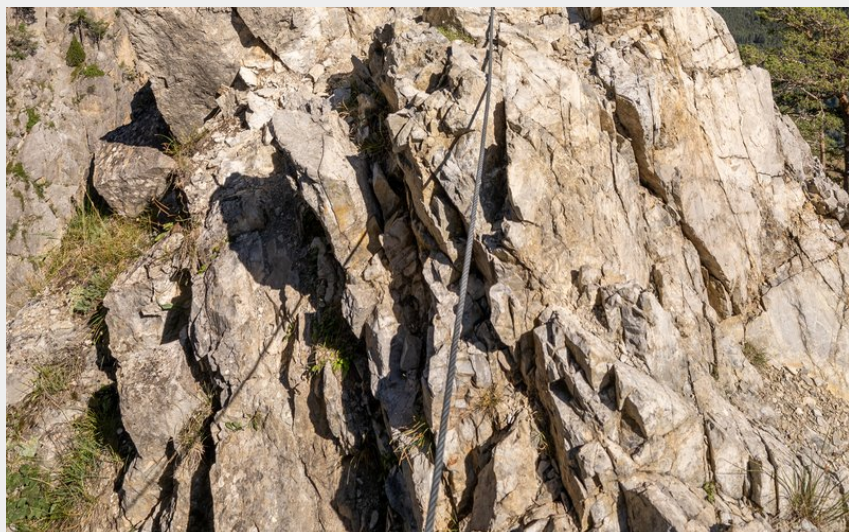
Vue de la croix de Toulouse