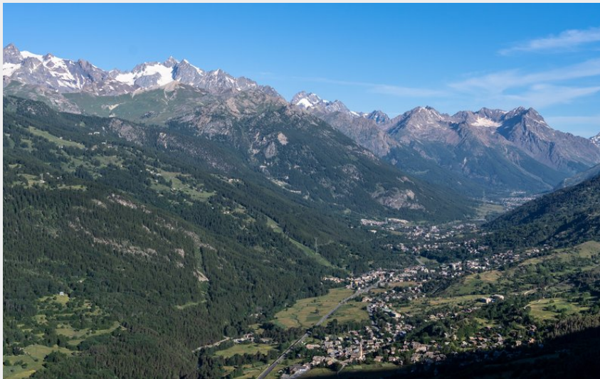
Vue sur la vallée de Serre Chevalier (David Gouel)