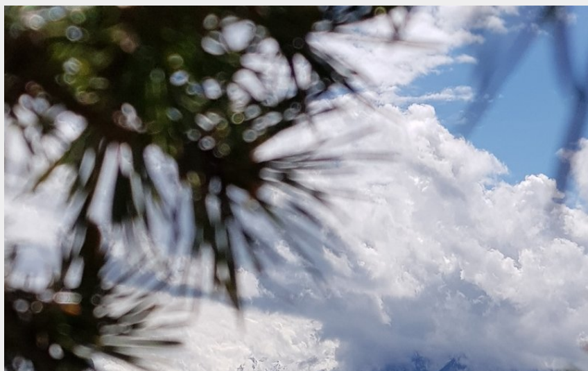
Panorama depuis le Ruban (Peudon Steven)