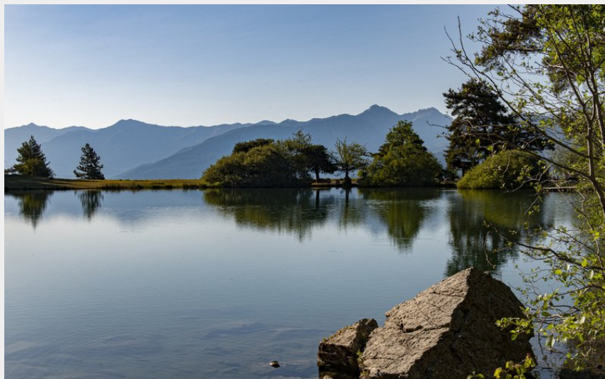
Vue sur le lac de Saint-Apollinaire (LeNaturgraphe)