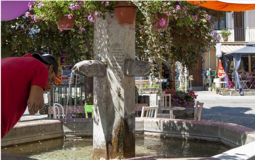
Place du village de Châteauroux-les-Alpes