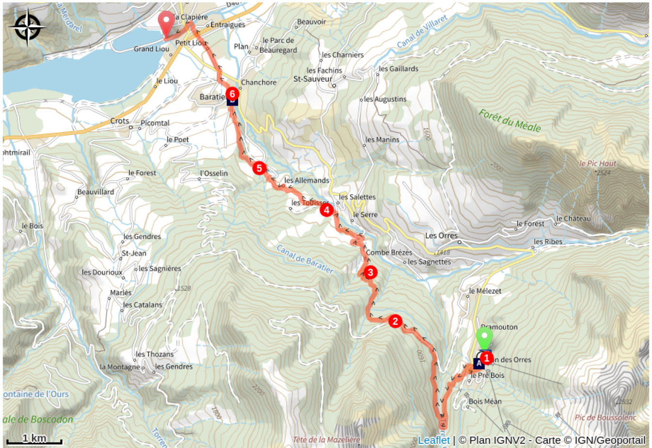
Station des Orres (A)