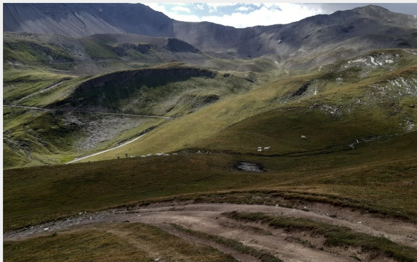
Col du Parpaillon en arrière plan (florimont.tilliere)