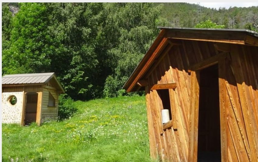
Cabanes éco-construites