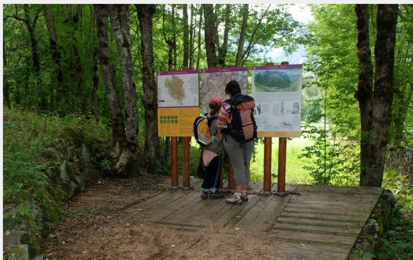
Porte d'entrée des Andrieux (Dominique Vincent - PNE)