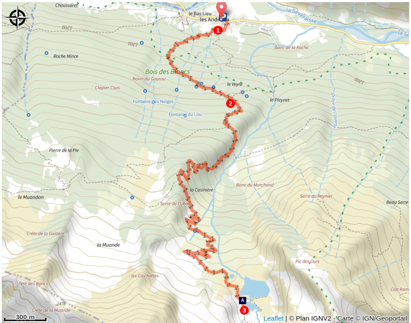
Lacs de Pétaarel (A)