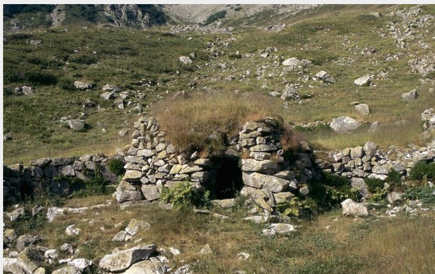
Vallon des six cabanes (Marie-Paule Hachon - PNE)