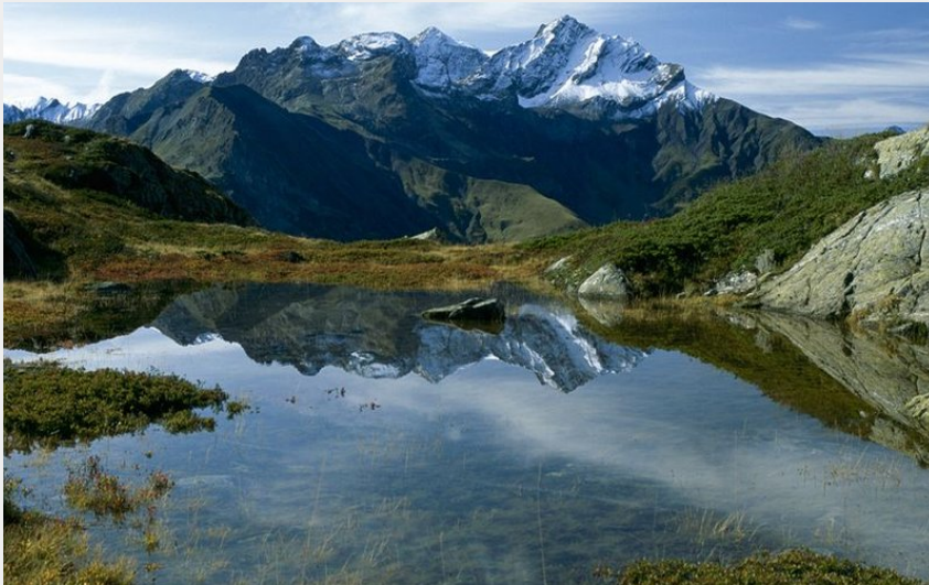
Aiguille de Morges depuis Tirière, commune de La Chapelle en Valgaudemar