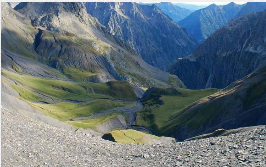
Panorama au col de Vallonpierre (Olivier Warluzelle - PNE)