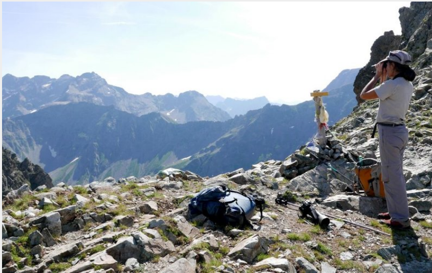
Col de Font Froide