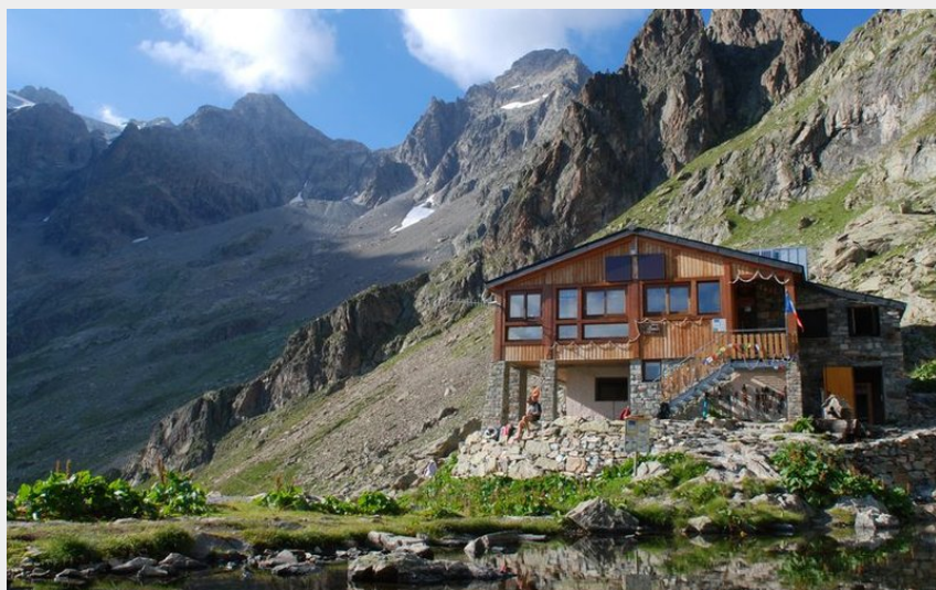
Le refuge du Pigeonnier