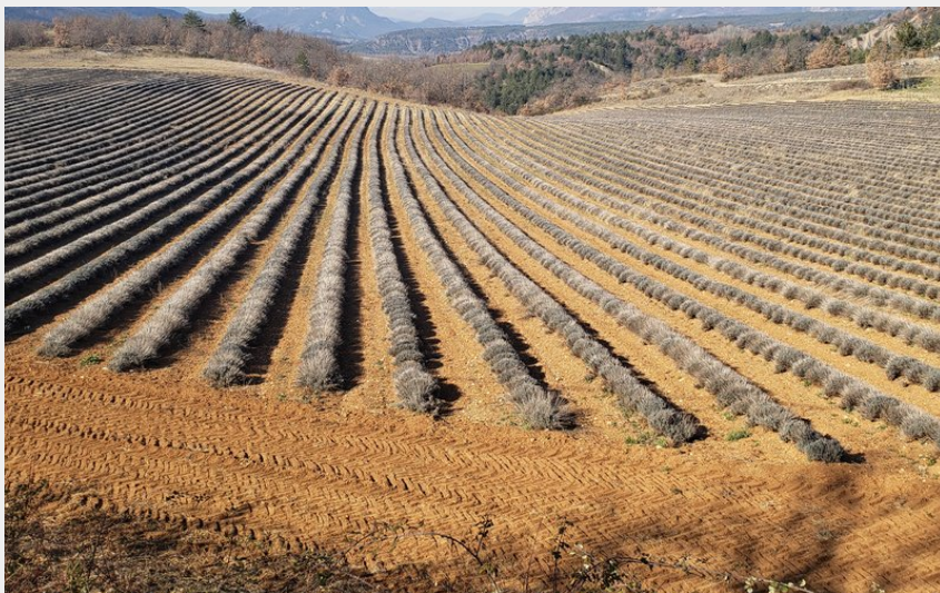
Champs de lavande (CCSB)

CC du Sisteronais-Buëch - Laragne-Montéglin