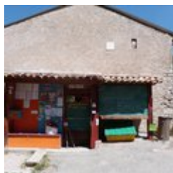
Tableau d'affichage (B)