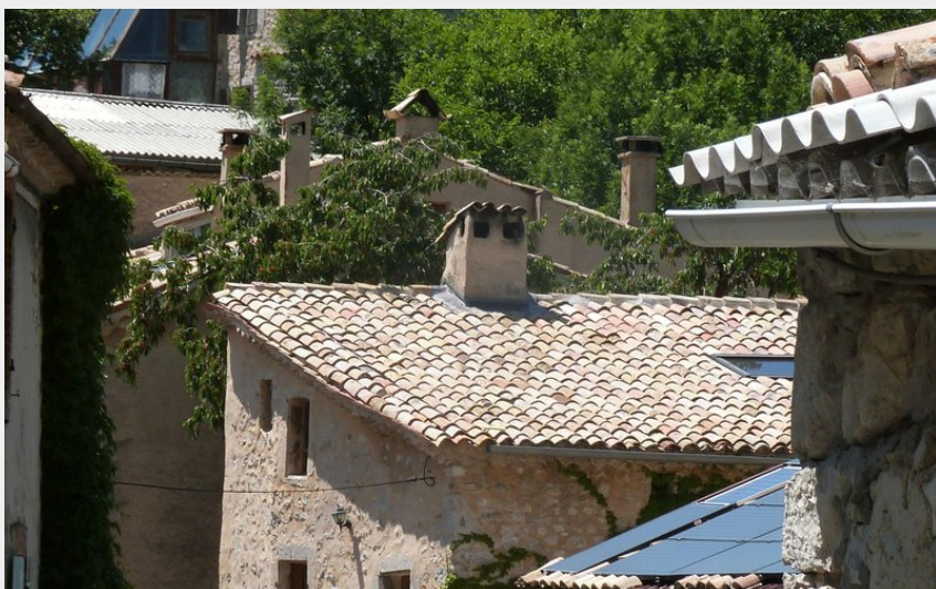
Le charmant village d'Eourres (CDRP05)