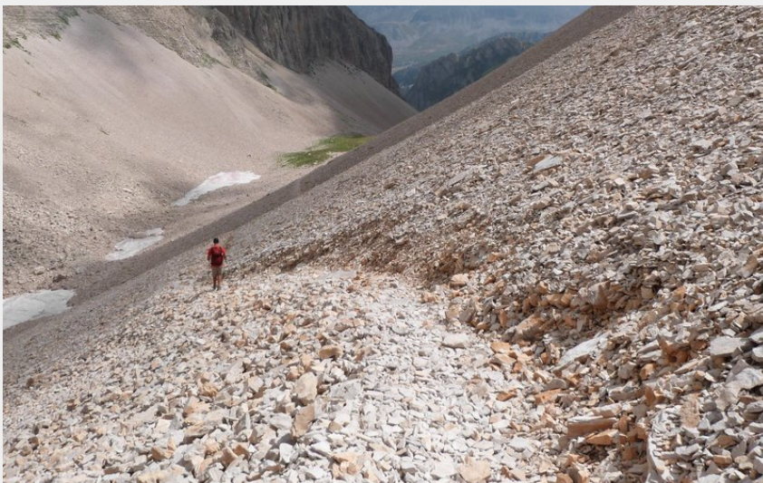
La Combe Ratin (CDRP05)