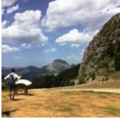
Table d'orientation et panorama (J)

Au collet du Tat, profitez d'une superbe vue sur Le Dévoluy