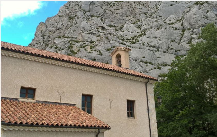
Le fameux site d'escalade de Sigottier (CDRP05)