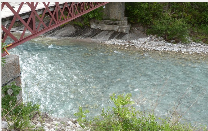
Traversée du Petit Buëch à Veynes (CDRP05)