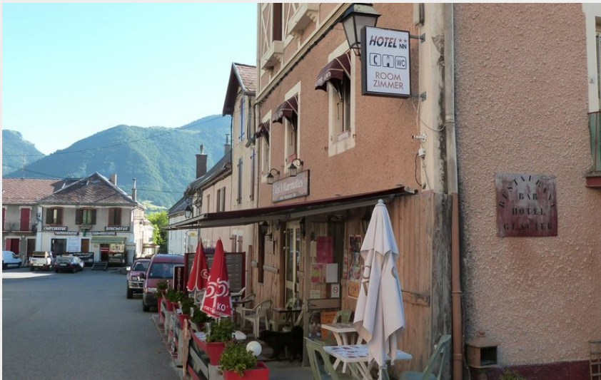
Centre de Lus-la-Croix-Haute (CDRP05)