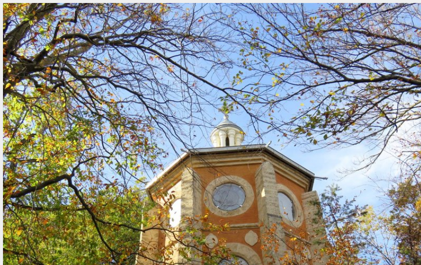
La chapelle du Précieux Sang (CDRP05)