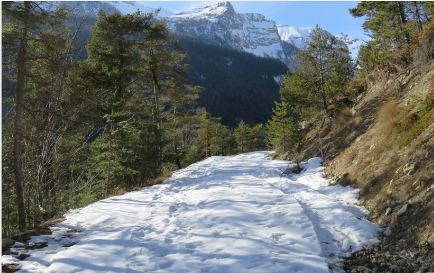
Les crêtes de Méan et de Chabreyret dominant la vallée du Couleau (CDRP05)