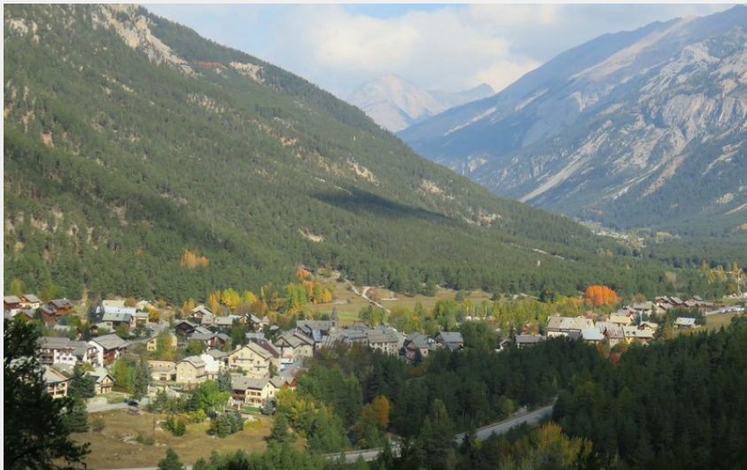
A l'entée de la vallée de la Clarée le hameau de la Vachette (CDRP05)