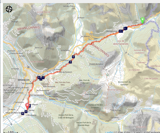
A l'entée de la vallée de la Clarée le hameau de la Vachette (CDRP05)