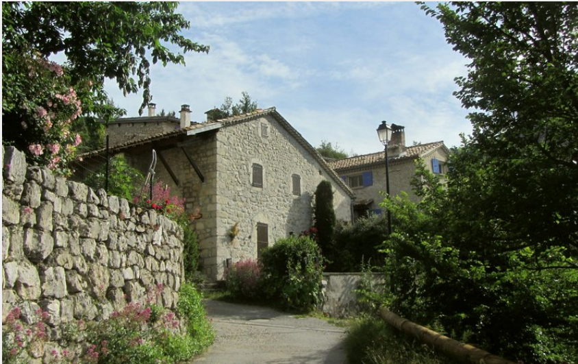
Hameau de la Pierre (CDRP05)