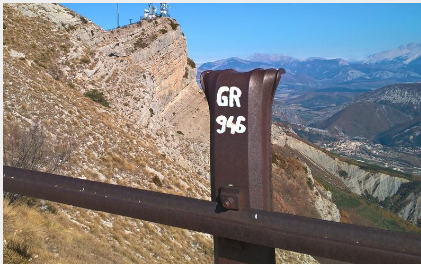
Le fameux Rocher de Beaumont (CDRP05)