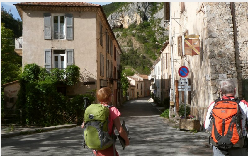
Dans les ruelles du village d'Orpierre (CDRP05)