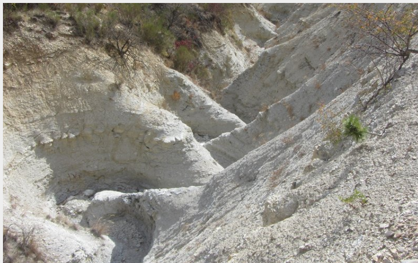
En grimpant juste au dessus de Barret-sur-Méouge (CDRP05)