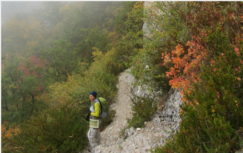
Le long des gorges de la Méouge (CDRP05)